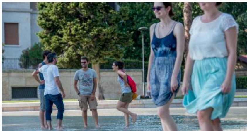
Alcuni ragazzi si rinfrescano nella vasca dell'Arsenale. Nei prossimi giorni dominerà il bel tempo

NOTA METEO. Il bel tempo è garantito dall'alta pressione delle Azzorre