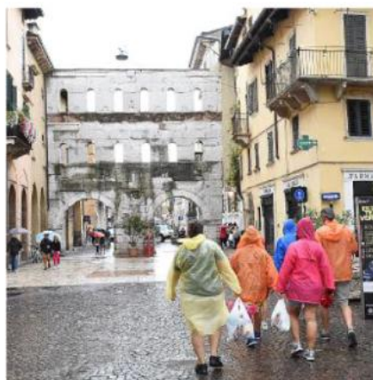
Turisti sotto la pioggia a Porta Borsari

Mercoledì il tempo rimarrà ancora instabile, con rischio elevato di temporali anche forti nelle ore tardo-pomeridiane. Farà però più fresco,