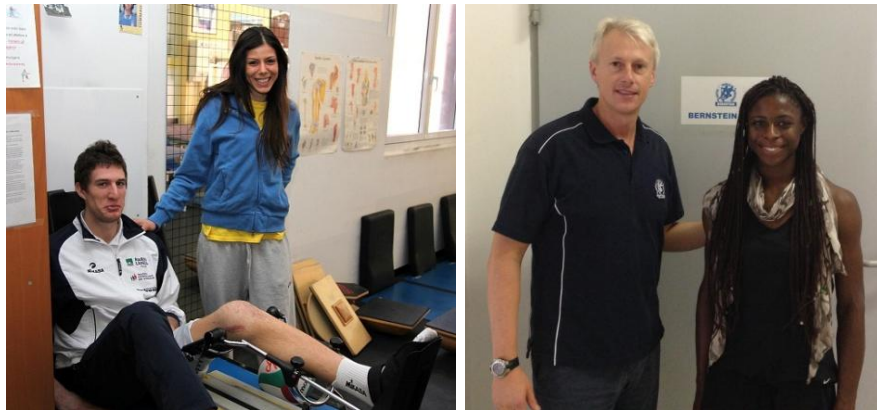
ATLETI IMPORTANTI SI SONO CURATI NEI NOSTRI CENTRI

I programmi riabilitativi potranno essere effettuati presso il Centro Bernstein di Verona oppure presso il Centro Bernstein di Domegliara.