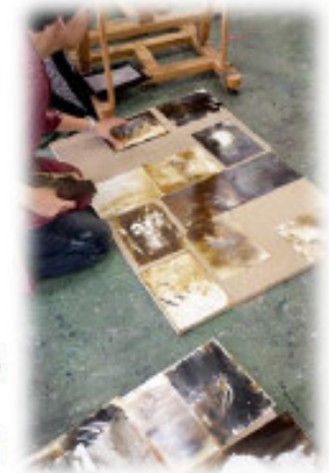
Arte e Comunicazione