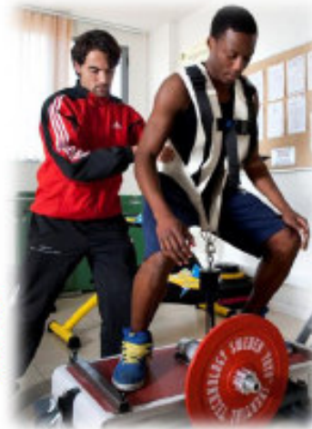
Scienze dello Sport